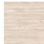
MI13 Encino Polar