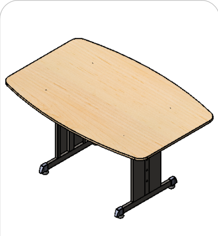
Patente en trámite Patent Pending

*****Para cualquier aclaración o comentario acerca de una garantía de este producto favor de conservar los datos señalados en la etiqueta que se encuentra en la parte inferior de la cubierta*****