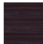
MI12 Ebanos boreal