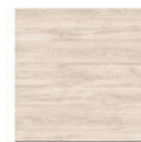
MI13 Encino Polar