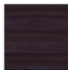
MI12 Ebano boreal