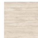
MI13 Encino Polar