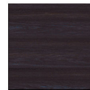
MI12 Ebanó boreal